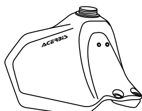
A - (1 pcs.)